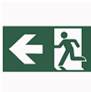
ACC PICTO. DIANA FLAT HOMME + FLECHE GAUCHEUIERDA