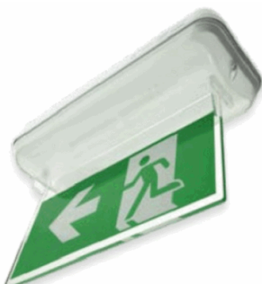
ACC DIF. BANDE ARIAN BLANC SANS SERIGR.