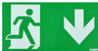
ACC PICTO. DIANA FLAT HOMME + FLECHE BAS