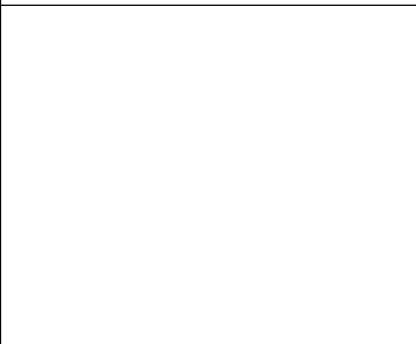
ACC BRIDA FIJACION SUP ARIAN